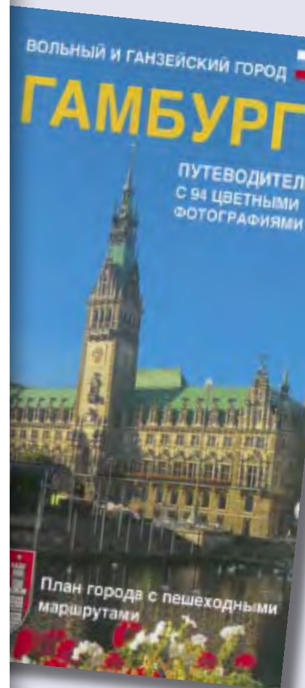
Mit 27 verschiedenen Sprachen bietet die Hamburger Volkshochschule in diesem Bereich von allen Volkshochschulen bundesweit das breiteste Angebot