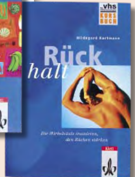
Unterrichtsmaterial, zum Teil von der Hamburger Volkshochschule in Zusammenarbeit mit dem Klett Verlag entwickelt